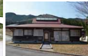
屋外活動センター