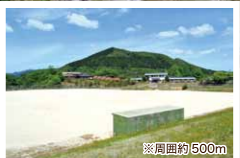
グラウンド (多目的広場)