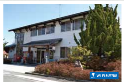
緑の館 (レストラン) (ミーティングルーム)