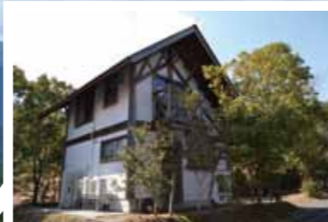
バンガロー・コテージ